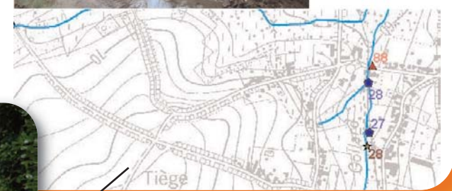
Carte N° 22