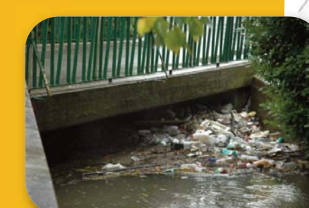
Déchets dans le lit du cours d'eau