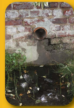
Rejet d'eau usée