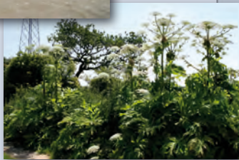
Recensement des plantes invasives