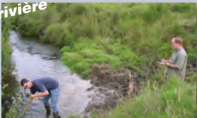
Mesure de la qualité de l'eau

Développer les inventaires du Contrat de rivière