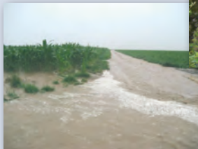
Coulée de boue