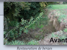
Restauration de berges

Résoudre les points noirs le long des cours d'eau