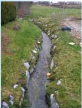
restauration de berges le Gentissart à Villers-la-Ville