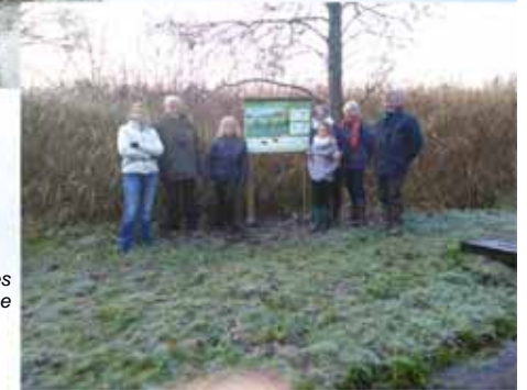
panneaux didactiques le Ru Milhoux à Lasne