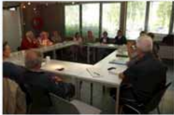
les pollutions accidentelles réunion à Wavre