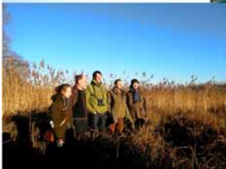
réserve naturelle « Pré du Duc » le Thorembais à Perwez