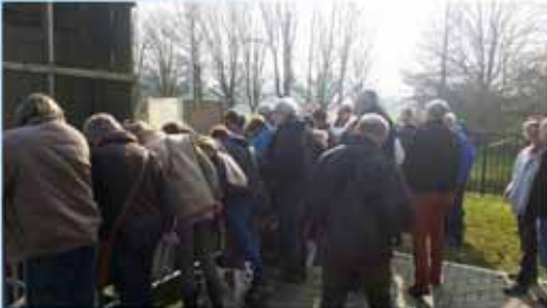
station d'épuration de la Dyle à Wavre (Intercommunale du BW)