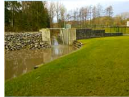
zone d'expansion de crue la Thyle à Court-St-Etienne