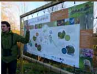
Domaine du Stampia la Grande Gette à Jodoigne