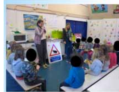
animation scolaire à La Hulpe (La Hulpe Environnement)