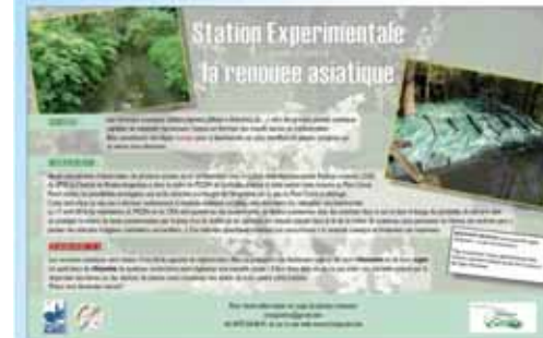
panneau didactique « renouée » à La Hulpe (Groupe CR Argentine)