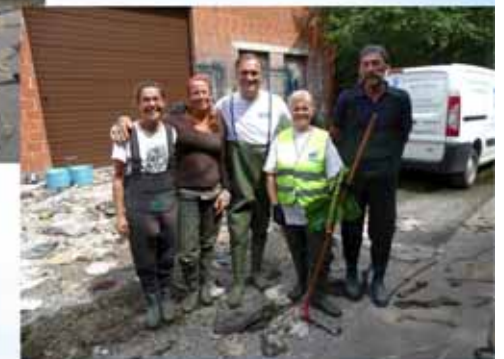
la Néthen à Grez-Doiceau