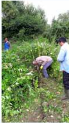
chantier « balsamine » le Gobertange à Jodoigne