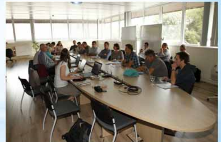
la masse d'eau de la Lasne réunion à la step IBW de Rosières (Rixensart)