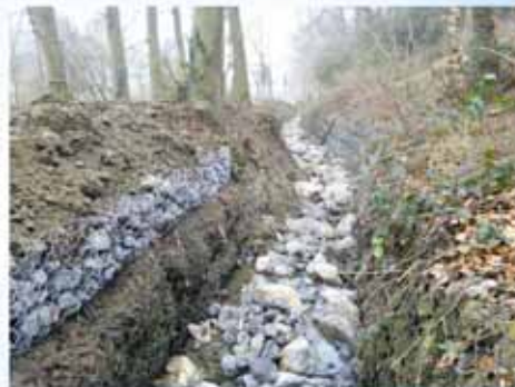
approche globale le Ruisseau du château à Rixensart