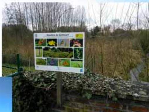
réserve naturelle « 5N+ » le Gentissart à Villers-la-Ville