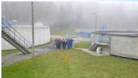
station d'épuration de Waterloo (Intercommunale du BW)