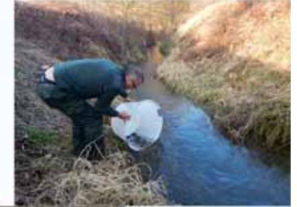
translocation de chabots de l'Orne à Court-St-Etienne ... à la Néthen à Beauvechain