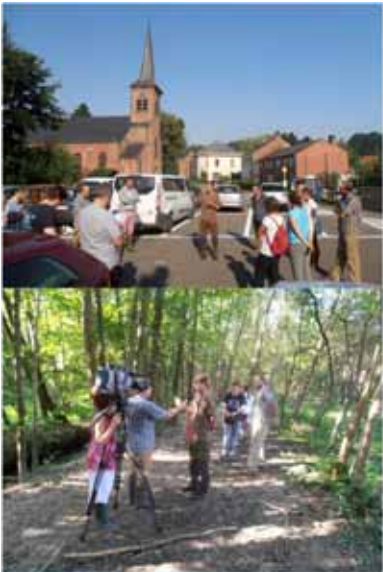
rencontre avec la presse le Ry d'Hez à Court-St-Etienne