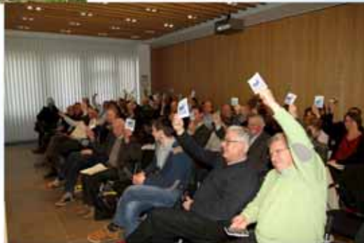
adoption de l'inventaire le 18 mars 2016