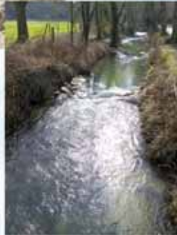
cascatelles le Train à Grez-Doiceau