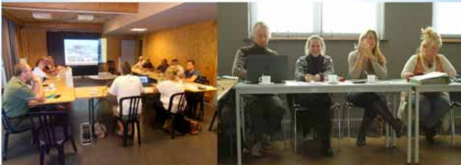
GT n° 1 à Orp-Jauche