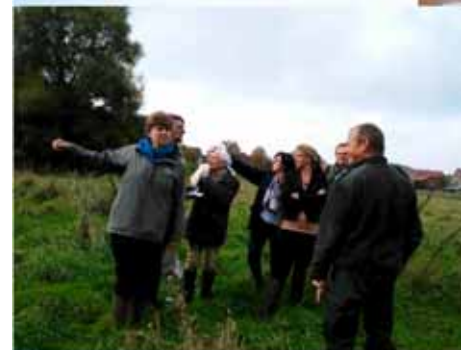
vallée du Train à Grez-Doiceau