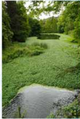
prolifération de l'hydrocotyle l'Argentine à Waterloo/La Hulpe