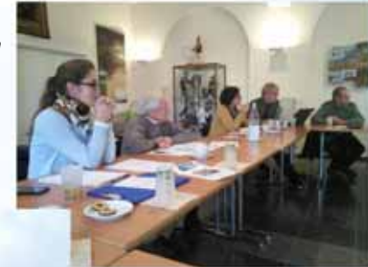
GT n° 3 à Beauvechain