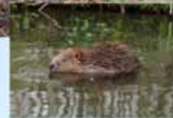
cohabitation avec le castor le Ry d'Hez à Court-St-Etienne