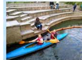
Journée des sentes/de l'environnement à Jodoigne ( Centre culturel de Jodoigne + CCBW + Ville de Jodoigne)