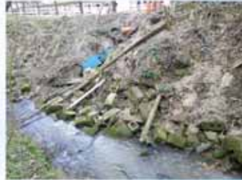
les gros dépôts de déchets réunion à Chaumont-Gistoux