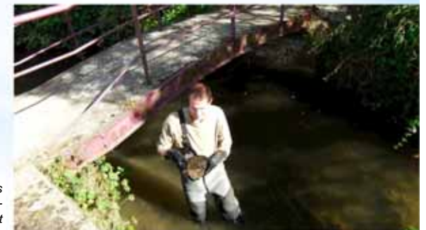
analyses biologiques la Houssière à Mont-St- Guibert