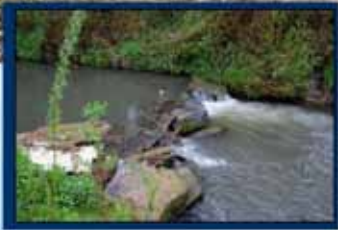
piège à branches la Petite Gette à Orp-Jauche/Lincent