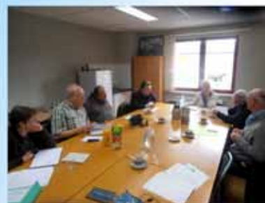
Pool d'animateurs « CRDG » réunion à Perwez