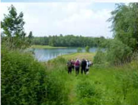
réserve naturelle de Gentissart à Villers-la-Ville