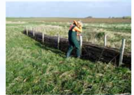
fascines à Orp-Jauche