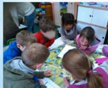
Ecole St-Jean-Baptiste à Ramillies