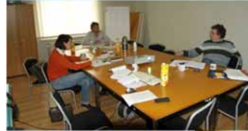
l'Intercommunale du BW réunion à Perwez