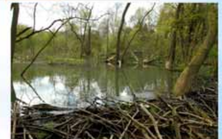
réserve naturelle « du Ronvau » le Ry du Pré Delcourt à Chaumont-Gistoux