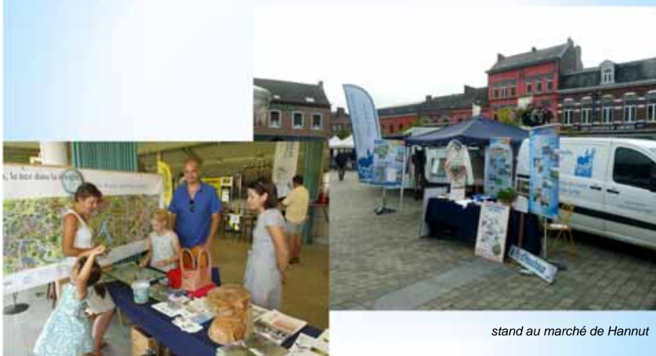
stand au marché de Hannut