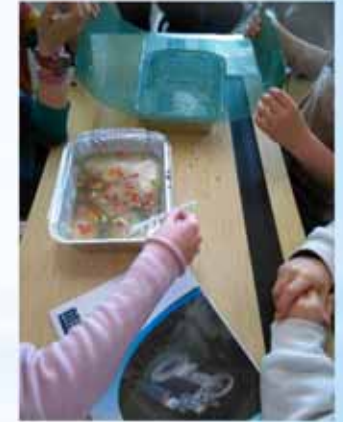
animation scolaire à Hélécinne (GAL Culturalité en Hesbaye brabançonne)