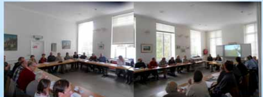
AG du 6 octobre à Hélécinie