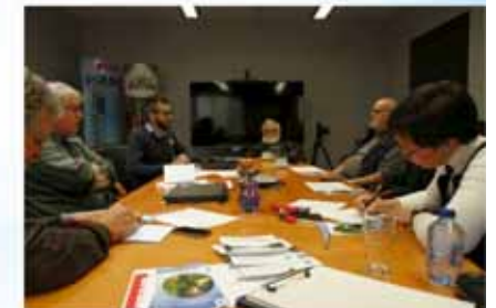
cohabitation avec le castor la Dyle à Walibi (Wavre)