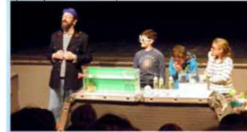
spectacle « Waterplouf » à Rixensart (Compagnie Al Kymia)