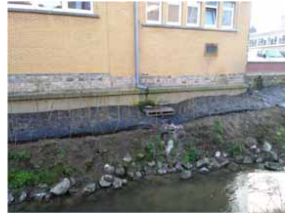
chantier « renouée » la Dyle à Wavre