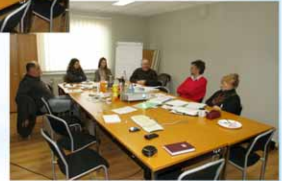
les gestionnaires des cours d'eau (SPW+ PBW + PLiège) réunion à Perwez