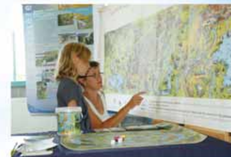
Forum des associations à Walhain