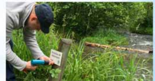
Signalétique des cours d'eau